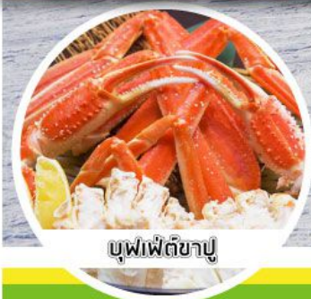
บุฟเฟ่ต์ขาปู