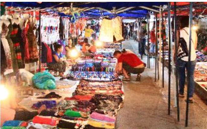
บรรยากาศตลาดกลางคืน