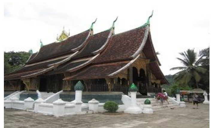
วัดเชียงทอง