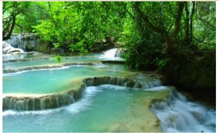
น้ำตกกวางสี