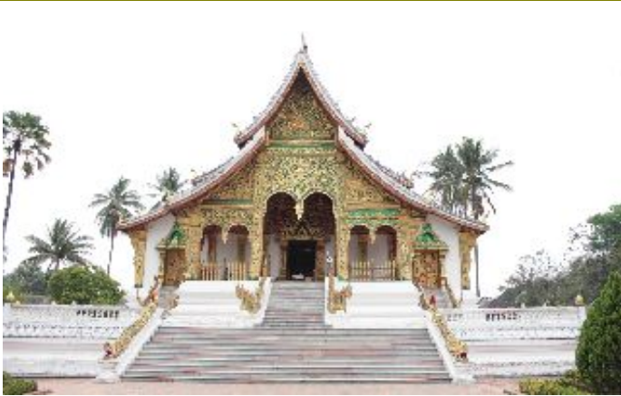
พระราชวัง และ หอพิพิธภัณฑ์หลวงพระบาง

ถ่ายรูปคู่ ณ วัดแห่งนี้ และ ที่พลาดไม่ได้ ต้อง ชมพระม่าน ในโบสถ์เล็ก (จะมีช่องเล็ก ๆ ให้ทุกคน หรีดาข้างหนึ่งมองเข้าไป จึงจะเห็น) พระม่าน หนึ่งปีจะอันเชิญ แห่รอบเมืองหลวงพระบาง ในเทศกาลสงกรานต์ ปีใหม่ลาว เพื่อให้ประชาชนสักการบูชา อย่างใกล้ชิด หากยังไม่จุใจ ไปอุ้มพระเสี่ยงทาย อยู่ใกล้ ๆ หอพระม่าน ก็ลองอธิษฐานเสี่ยงทายกันดู ดวงใคร ดวงมัน หลายท่านพิสูจน์แล้วว่าแม่นยำจริงๆ ไม่เชื่อลองตั้งจิตอธิษฐาน พิสูจน์ได้ด้วยตัวเอง