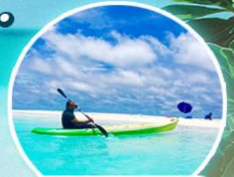
Sand Bank (พายเรือคายัค)