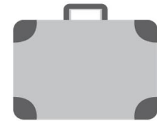
น้ำหนักสัมภาระ ขาไป - ขากลับ 20 กก.