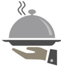
เสิร์ฟอาหาร ทั้งขาไป-ขากลับ