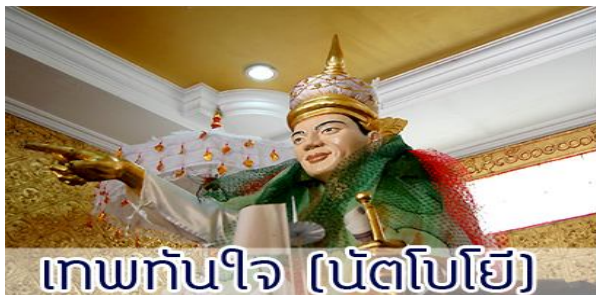
เทพทันใจ (นัตโบโย)

ไสยาสน์ชเวตาเลียว” หรือพระนอนอิมหวาน ซึ่งเป็นพระนอนที่งดงามที่สุด ของเมืองหงสาวดี อีกทั้งยังสามารถเลือกซื้อของฝาก อาทิ ไม้แกะสลัก ผ้าปักพื้นเมือง ผ้าพื้นเมือง เป็นของฝากคนทางบ้าน จากนั้นนำท่านเดินทางกลับกรุงย่างกุ้ง นำท่านเดินทางไปชม พระเจดีย์โบตตะตอง ซึ่งเป็นเจดีย์ที่สร้างขึ้นเพื่อรับพระเกศาธาตุก่อนที่นำไปบรรจุในพระเจดีย์ชเวดากอง เมื่อพระเกศาธาตุได้ ถูกอัญเชิญขึ้นจากเรือได้นำมาประดิษฐานไว้ที่พระเจดีย์โบตตะตองแห่งนี้ก่อน พระเจดีย์แห่งนี้ได้ถูก ทำลายในระหว่างสงครามโลกครั้งที่ 2 และได้รับการปฏิสังขรณ์ขึ้นมาใหม่ โดยมีความแตกต่างกับพระเจดีย์ทั่วไปคือ ออกแบบให้ใต้ฐานพระเจดีย์มีโครงสร้างโปร่งให้คนเดินเข้าไปภายในได้ โดยอัญเชิญ พระบรมธาตุไว้ในผอบทองคำให้ผู้คนได้เข้ามา กราบไหว้มองเห็นได้ชัดเจน ส่วนผนังใต้ฐานเจดีย์ ได้นำทองคำและของมีค่าต่าง ๆ ที่มีพุทธศาสนิกชนชาวพม่านำมาถวายแก่องค์พระเจดีย์ มาจัดแสดงไว้ นำท่านสักการะขอพรจาก “เทพทันใจ” (นัตโบโย) ซึ่งชาวพม่าให้ความเคารพอย่างมากและนิยมมาขอพร ด้วยเชื่อว่าอธิฐานสิ่งใดจะสมความปรารถนา จากนั้นนำท่านขอพรจาก เทพกระซิบ แล้วช้อปปิ้งตลาดสก๊อต